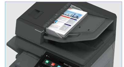
Le chargeur recto verso grande capacité 300 feuilles balaie les documents à une cadence de jusqu'à 300 images par minute.