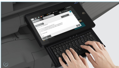
Le clavier escamotable intégré simplifie la saisie d'adresses courriel et de champs d'objet.