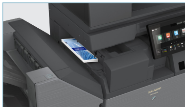
Le module de pliage interne en option propose une variété de profils de pliage, comme pli accordéon et pli roulé, entre autres.